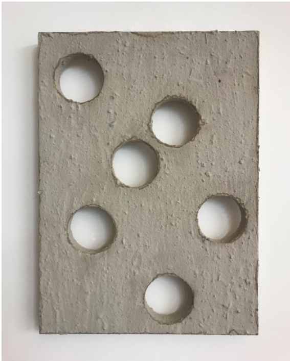
„L 'ARRANGEMENT LIBRE ...“, 2023/24 Mixed Media; 40 x 29 x 2,5 cm

wieder einmal wende ich mich an Euch / an Sie mit einem Hinweis auf zwei meiner Projekte, für deren Realisierung ich eine Edition auflege.